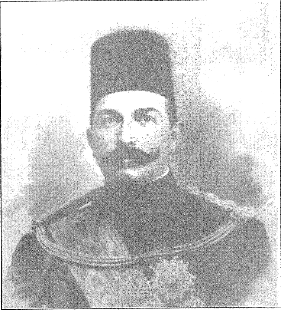
الخليو عباس حلمى الثانى انتهز الإنجليز فرصة وجوده بالأستانة وخلصوه